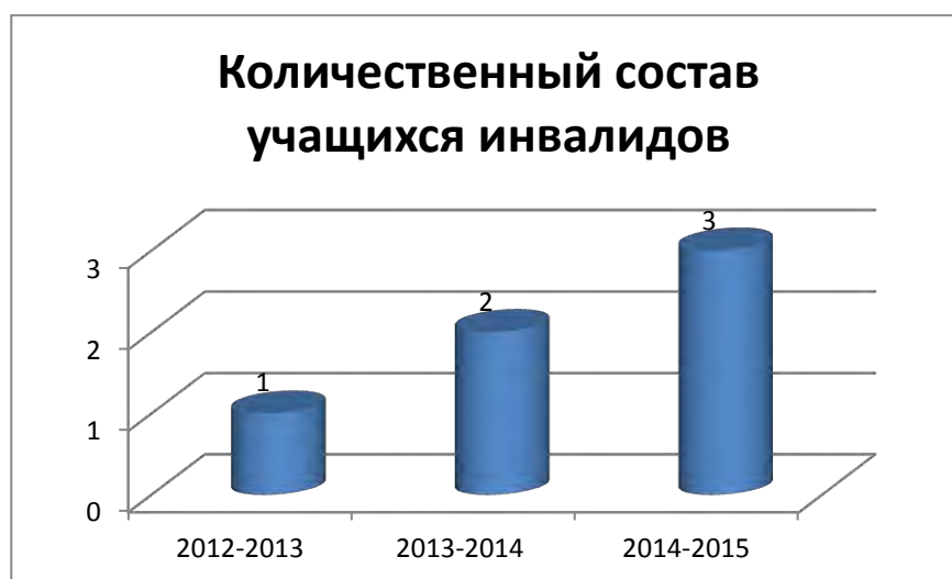
Рис. 2. Количественный состав учащихся-инвалидов

Учащиеся в количестве 5 человек обучаются на дому по индивидуальным программам, составленным с учетом пожеланий законных представителей обучающихся: 1 класс - 2 человека (1ребёнок-инвалид, 1-ОВЗ), 3 класс – 1 человек(1ребёнок -ОВЗ), 4 класс – 2 человека (1ребёно-инвалид, 1-ОВЗ). С этим контингентом учащихся работает 7 педагогов.