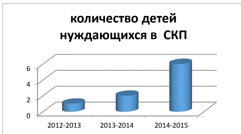
Рис. 1. Количественный состав учащихся в СКО

По сравнению с 2013-2014и предыдущими учебными годами количество детей СКО увеличилось.